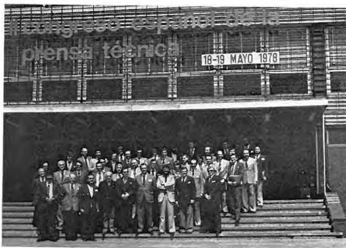
Foto para el recuerdo. Un grupo de participantes, ante el Palacio de Congresos, en el Parque de Ferias y Exposiciones de Montjuïc.

idad claramente sentida por los asociados, y expresada también en el marco de los debates suscitados por algunas ponencias.