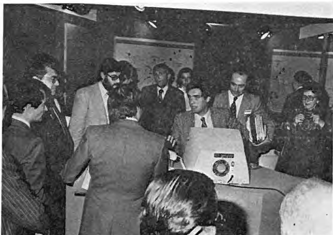
Demstraciones de información automatizada, en el stand que montó la Red Inca, de Fundesco, en paralelo con el Congreso. Terminales conectados a Bancos de Datos de Estados Unidos.