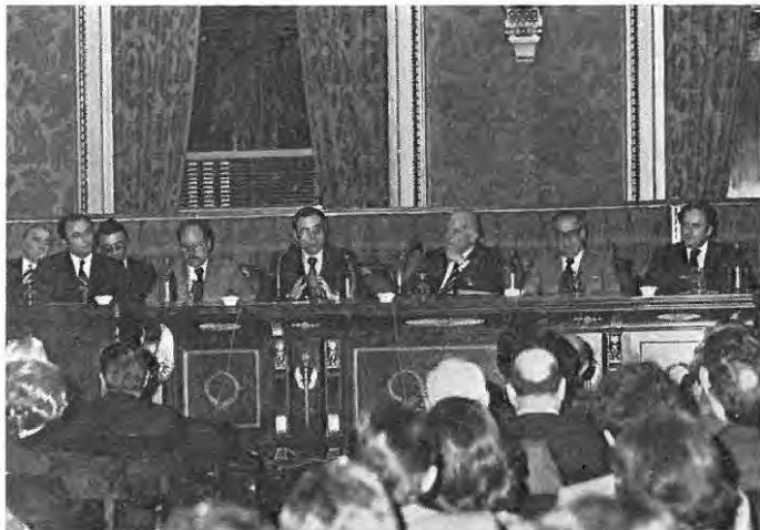
Presidencia del acto inaugural del Congreso.