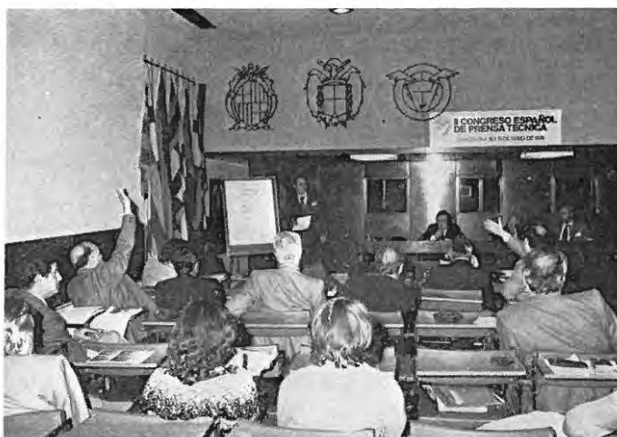
Reunión plenaria, el día 19, en la Sala A. Se está debatiendo la ponencia relativa a la estructura y funciones de la AEPT en el futuro desarrollo de la Prensa Técnica española.