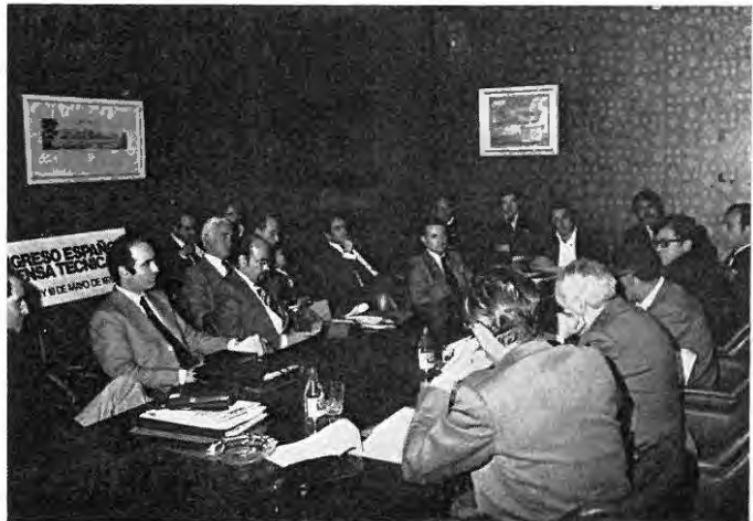
Una de las reuniones de trabajo, en la sala B. El día 18, por la densidad del programa, fue necesario simultanear ponencias dividiendo al auditorio.