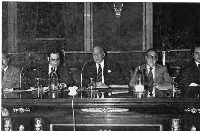
Momento en que el President de la Generalitat de Catalunya, Honorable Tarradellas, dirige la palabra a los congresistas en la sesión inaugural.