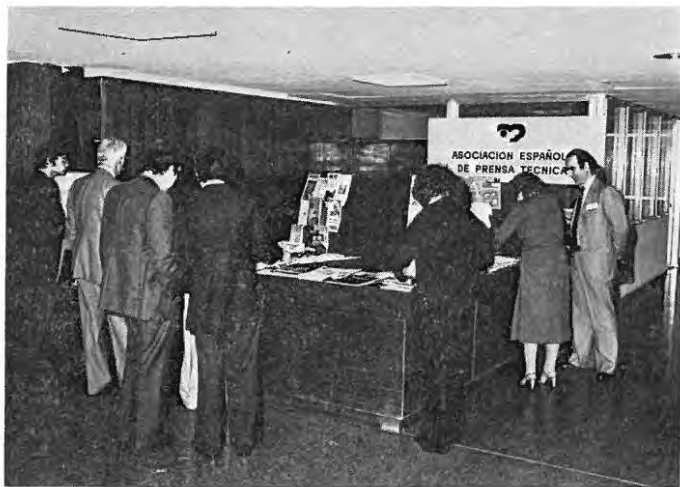
Exposición de revistas técnicas asociadas a la AEPT, anexa al Congreso. Despertó gran atención entre los asistentes, que recogieron numerosos ejemplares de muestra, así como Catálogos.