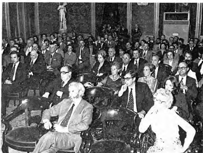
Una vista del Salón Dorado de la Lonja, durante el acto inaugural. Junto a los congresistas estuvieron presentes numerosas personalidades de la vida económica, profesional y cultural y de los medios de comunicación.