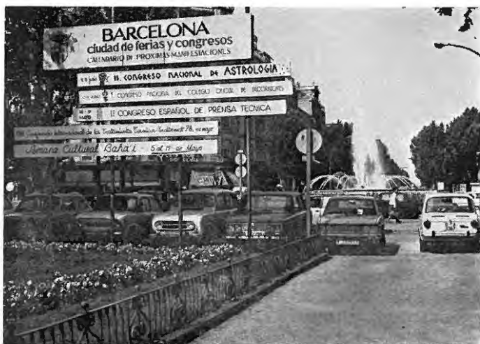
El II Congreso Español de Prensa Técnica era noticia en la calle durante las semanas que precedieron a la inauguración. En la foto, cartelera situada en el cruce Gran Vía - Paseo de Gracia, delante del Avenida Palace.