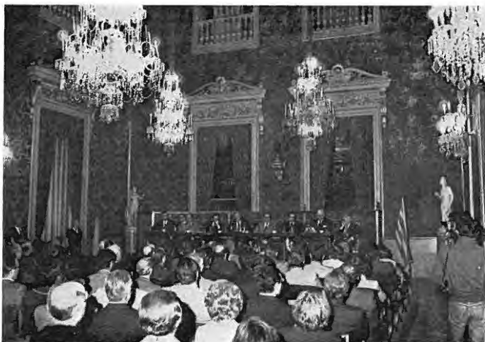
Brillante aspecto del Salón Dorado de la Casa Lonja de Mar, durante el acto inaugural, en la tarde del miércoles 17 de mayo.